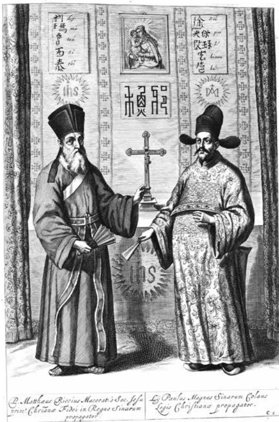
מתאו ריצ'י והמלומד והפקיד הבכיר שו גואנגצ'י (徐光啓), תחריט משנת 1667, מתוך ספרו של אתנסיוס קירכר (Kircher) סין מתוארת בציורים ( China illustrata ). הקשר בין השניים הוא דוגמה לרשתות האינטלקטואליות שנוצרו בבייג'ינג.

חדישה מאירופה, למשל טלסקופ. במהלך השנים חודשה פעילותה של האקדמיה למתמטיקה בסמוך לעיר האסורה, וגם של האקדמיה לרפואה. 12 משרדי תרגום הוציאו לאור תרגומים של ספרות מדעית, אם באופן רשמי ואם באופן פרטי. בכל אלה היו גם הישועים מעורבים. במהלך המאה השמונה-עשרה פעלו הישועים גם כמעין "טכנאים" – בסדנאות ציור וניפוח זכוכית, בבנייה, למשל של מזרקות וארמונות, ובייצור תותחים מהדגם המערבי. דבר זה החל עוד בתקופת שלטונו של הקיסר קאנג-שי (康熙, שלט בשנים 1661–1722), שהיה חובב נלהב של מדעים. הישועים, אם באופן אישי ואם בכתבים שהוציאו לאור בסניף קלאסית, נהיו גם חלק מהרשתות החברתיות ומהדיונים הלמדניים בבייג'ינג ומעבר לה.